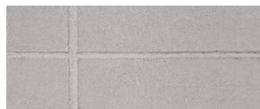
C. kvádrové reliéfní zdvo