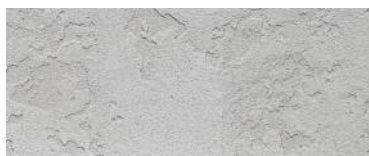
B. hrubý industriální beton